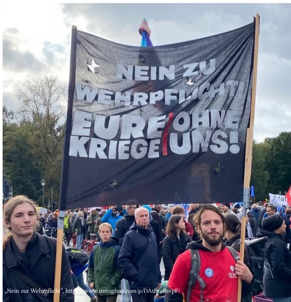
„Nein zur Wehrpflicht“, https://www.instagram.com/p/DA1fkaRsvpF/

Es ist schon richtig, dass die Musterungen – vorerst – nicht in der Schule stattfinden werden und auch die Musterungsbriefe nicht in der Schule ausgefüllt werden. Trotzdem ist die Schule auch ein Ort, an dem Aufrüstung stattfindet. In Saarbrücken beispielsweise soll ein neues Schulfach für „Zivilschutz und Resilienz“ eingeführt werden, in dem die Schüler:innen den Umgang mit Katastrophen und Extremsituationen lernen. Das bedeutet im Klartext: Schüler:innen sollen darauf vorbereitet werden, was sie zu tun haben, wenn Krieg in Deutschland herrscht.