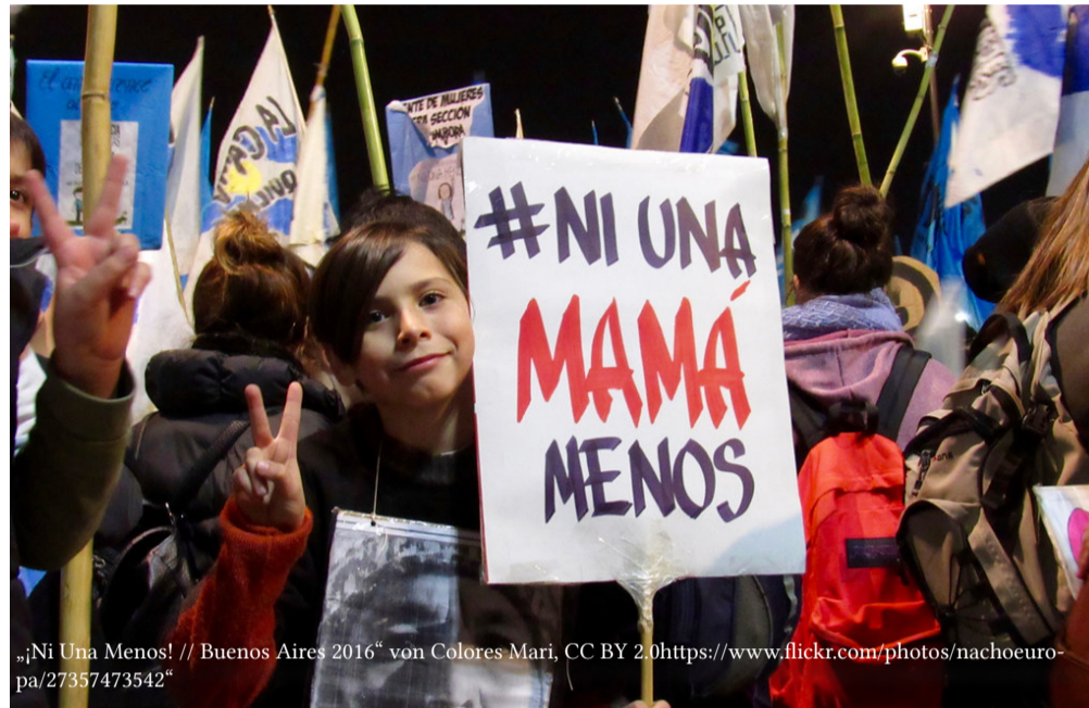
„Ni Una Menos! // Buenos Aires 2016“

Das Urteil des Oberverwaltungsgerichts Bremen: Der Lehrer muss „amtsangemessen“ beschäftigt werden. Denn eine Suspendierung ist nur zulässig, wenn eine Entfernung aus dem Beamtenverhältnis zu erwarten ist. Davon wird in der Beurteilung des gerichtlichen Eilverfahrens bisher nicht ausgegangen. Ein Disziplinarverfahren der Bildungsbehörde läuft momentan gegen den Lehrer, wobei der Sachverhalt geklärt wird. Es ist klar: Der Lehrer wird nicht